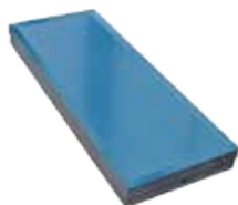
TAMPONE STRUTTURATO STRUCTURED PUNCH