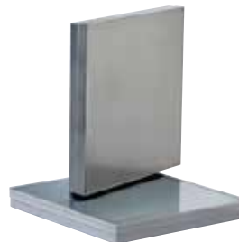
TAMPONE RESINA SPECIALE SPECIAL RESIN PUNCH