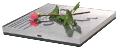
TAMPONE CROMATO CHROME-PLATED PUNCH

GOOD-FACE PUNCHES POINCONS POUR BELLE FACE PUNZONES POR CARA BUENA ЛИЦЕВЫЕ ПУАНСОНЫ